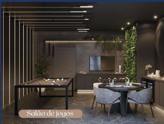
Salão de jogos