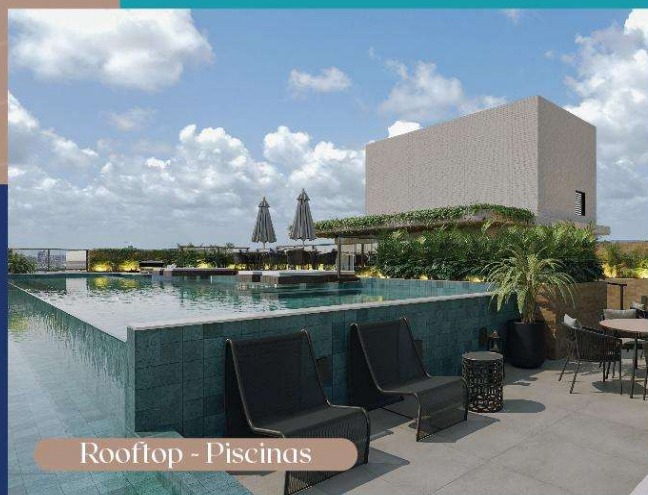
Rooftop - Piscinas