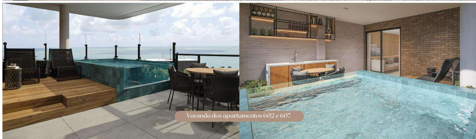
Varanda dos apartamentos 602 e 607