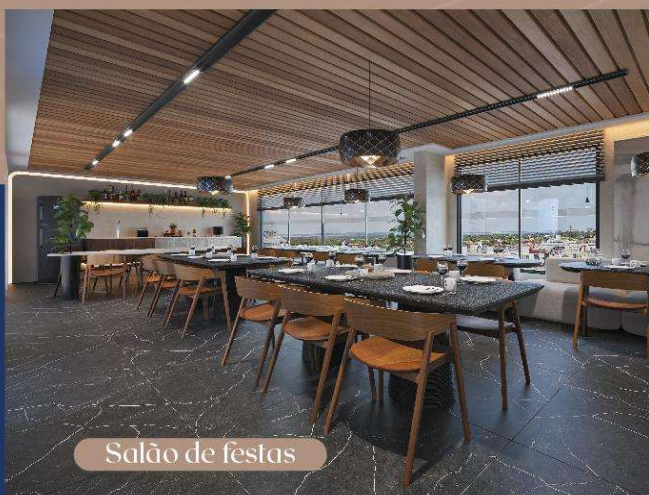
Salão de festas